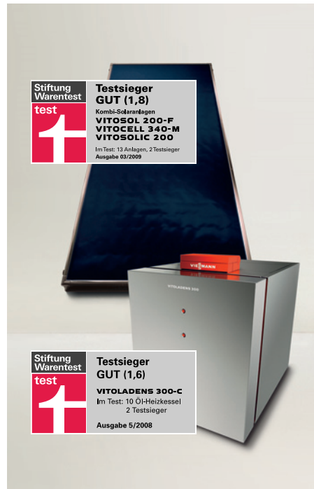
Das Effizienz-Duo: Viessmann ist sowohl für seinen Öl-Brennwertkessel Vitolasol 200-F als auch für seinen Sonnenkollektor Vitolasol 200-F von der Stiftung Warentest ausgezeichnet worden.

Sie suchen nach einer ausgezeichneten Heizlösung? Wir haben sie im Doppelpack.